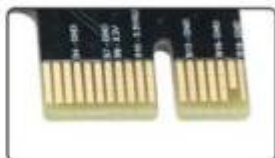
Just plug in on need load drive