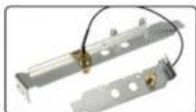
2*Fixed Plate stable and easy setup