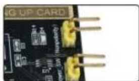
Dual power design don't disturb power button